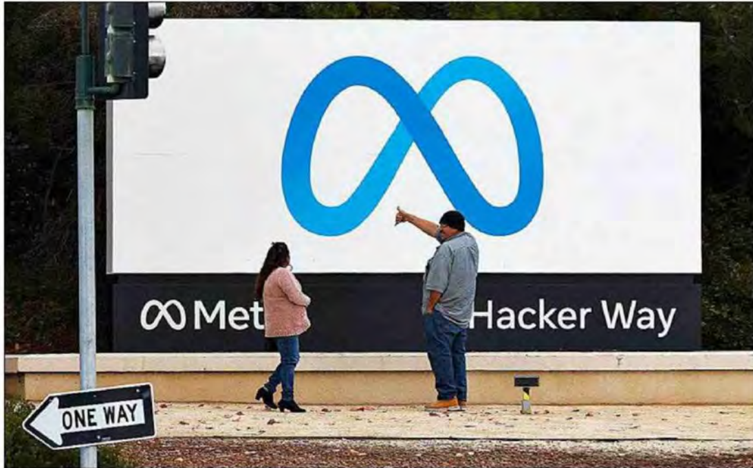
AÚN MÁS DESPIDOS EN META. Meta, que a finales de 2022 anunció un recorte de 11.000 empleos, prepara una nueva ronda de despidos, según el Financial Times. Los presupuestos internos se están retrasando por ello, dice.