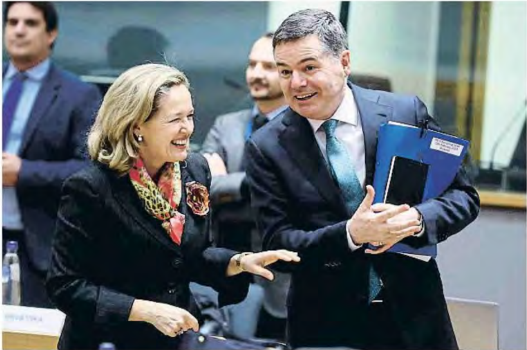
STEPHANIE LECOQ / EFE