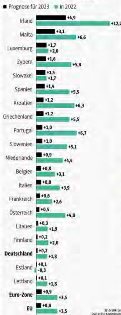
Veränderung des realen Bruttoinlandsprodukts in den Ländern der Euro-Zone, in Prozent

Bis dahin will die Kommission das komplizierte und schlecht durchgesetzte Regelwerk vereinfachen und realistischer gestalten. Gentiloni stellte im November einen Entwurf vor; die EU-Finanzminister wollten darüber bei ihrem Treffen in Brüssel am Montagmittag und Dienstagmorgen diskutieren. Im März sollen auch die Staats- und Regierungschefs bei ihrem Gipfel über den Pakt debattieren. Doch wenn zum Jahreswechsel wirklich ein reformierter Pakt in Kraft treten soll, müssen sich Kommission und die Regierungen sehr bald auf ein Konzept einigen. Ansonsten würde es schwierig, rechtzeitig die Gesetzesänderungen abzuschließen.