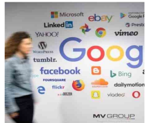
L'euphorie qui régnait dans le secteur de la tech a pris fin.

L'indice du Nasdaq (valeurs de la technologie cotées en Bourse aux États-Unis) avait été presque divisé par cinq en l'espace de deux ans et demi. Là, on vient juste d'effacer deux années de hausse et des compartiments actions plus diversifiés n'ont pas vraiment été affectés ».